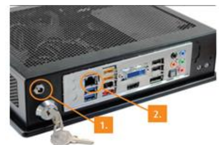
9Solutions HACCU: 1. Netzkabel Anschluss 2. Ethernet Kabelanschluss