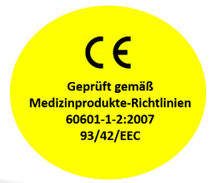
Rufanlagen-Rufempfänger für Rufanlage aller Marken + Typen